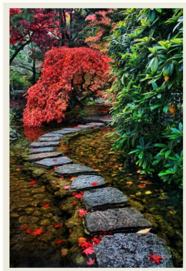
تصویر 4- خط راهنمای سنگ چین باعث شده است تا چشم مستقیماً به درخت افرآ توجه کند

ذکر این نکته ضروری است که سازماندهی عناصر درون کادر برای رسیدن به یک ترکیب بندی موفق ممکن است عکاس را در استفاده از لنزهای مختلف محدود کند ، که اغلب می توان با مختصری جابجایی فیزیکی خود ، این نقص را جبران کرد تا به ترکیب مناسبی دست یافت.