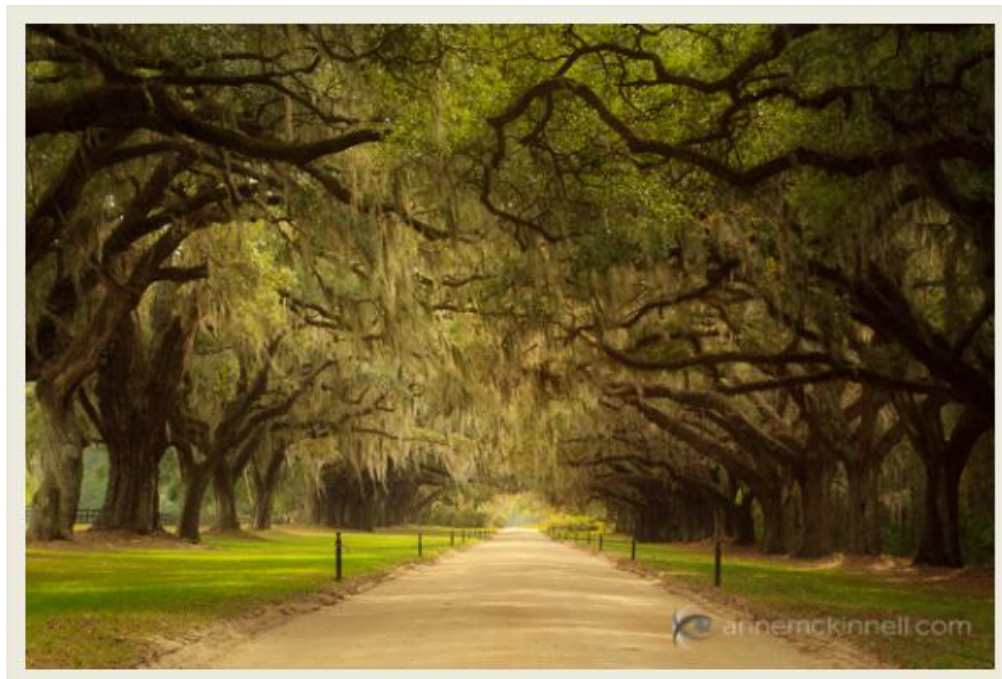
تصویر 1-خطوط منتهی الیه جاده با تلاقی شدن ،احساس بی نهایت را بوجود می آورند.

ساده ترین راه برای تشخیص خطوط راهنما مسیر جاده هاست. خطوط جاده ها بطور سنتی هدایت کننده ی چشم محسوب می شوند چون بهر حال آن ها به طرفی کشیده شده اند که به این ترتیب احساسی از حرکت را بوجود می آورند. به علاوه این خطوط معمولا " به یک نقطه تلاقی خواهند رسید؛ که اصطلاحا " به آن "نقطه ی بینهایت " یا - \infty - می گوئیم.