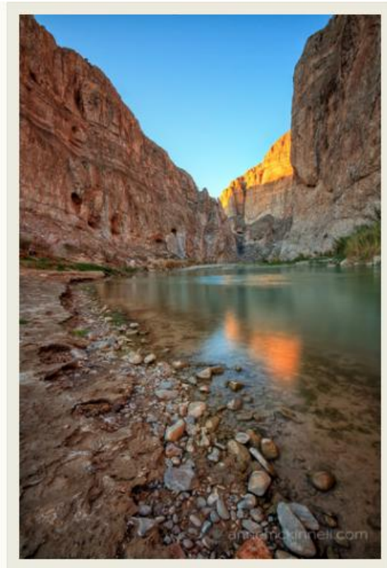
تصویر 3- خط ملایم لبه ی رودخانه به تصویر عمق بیشتری داده است

اگر بتوانید خطوط قوی را در کادر خود شناسایی کنید، آنگاه میتوانید به سادگی ارزش ترکیب بندی خود را افزایش دهید. بدین ترتیب براساس دقت نظری که به خرج می دهید، می توانید: